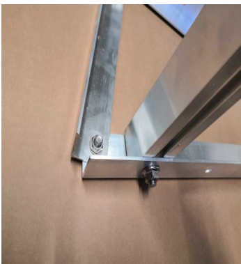
Abb. 08: Detail Verschraubung der Querschiene am Dreieck

Befestigen Sie nun den Wechselrichter an den vorgesehenen Bohrungen am Profil C (Abb. 07). Für kleinere Modulwechselrichter genügt eine Schraube, für die Zweifach-Modulwechselrichter sollten Sie zwei M8-Schrauben verwenden.