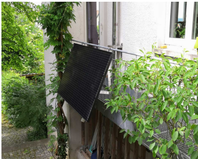
Abb. 01: Am Balkongeländer mit 25°-Neigung montiertes Solarmodul