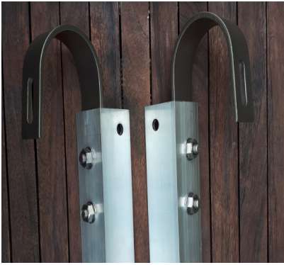
Abb. 06: Verschraubung der Edelstahlhaken