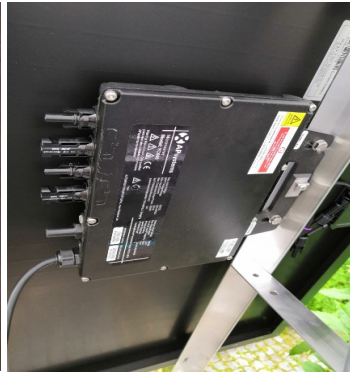
Abb. 07: An Profil C geschraubter Wechselrichter

Montieren Sie nun gemäß Abb. 02 das Profil A und das Profil B an Profil C und verbinden Sie abschließend Profil A und Profil B miteinander. Achten Sie darauf, dass sich die Winkel zur Modulmitte hin öffnen.