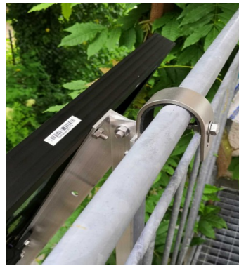
Abb. 09: Detail Edelstahlhaken mit montierter M8x50 Sicherungsschraube gegen Abheben

Verschrauben Sie schliesslich noch die Querschiene mit der unteren Bohrung (D 11 mm) des Profil A. Dazu stecken Sie lose die M10x20-Schraube von Innen durch die untere Bohrung des Profils und schrauben außen die Flanschnutter leicht auf. Stecken Sie dann die passende Nut der Querschiene in den Sechskant-Schraubenkopf bis zum Anschlag und ziehen Sie die Flanschnutter fest an (→ Abb.08). Wiederholen Sie dies am zweiten Dreieck.