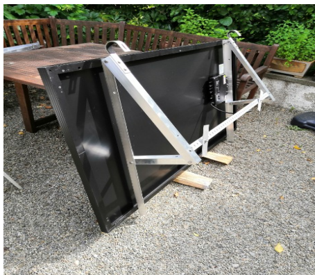
Abb. 04: Ansicht der Modulrückseite mit montierten Dreiecken, Edelstahlhaken und der Querschiene (alte Version).

Legen Sie das Solarmodul vorsichtig mit der Glasseite nach unten auf eine ebene, kratzfreie Unterlage oder stellen Sie das Modul etwas erhöht und rutschsicher mit der langen Kantenseite auf den Boden (z.B. auf Kanthölzer). Lehnen Sie es vorsichtig z.B. an einer Wand an, so dass Sie die Rückseite des Moduls vor sich haben (Abb. 04).